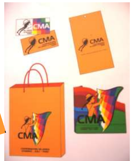
Imagen de marca. Logotipo en etiquetas. Historia de la comunidad en español, inglés y aymara.