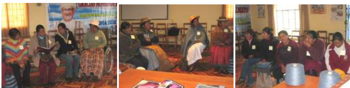
Participantes en el Taller durante el mes de marzo de 2009

El trabajo del taller consistió en la elaboración de los distintos productos de la colección diseñada.