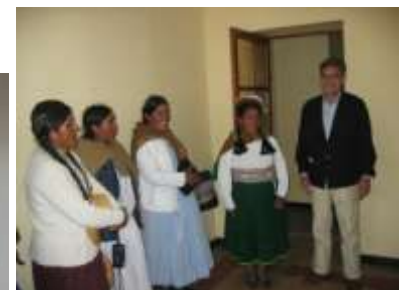
Sede de la Coordinadora de Mujeres Aymaras en Juli