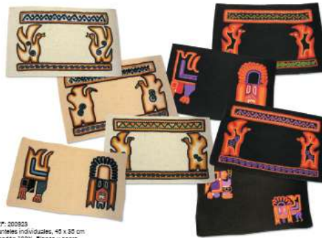
RCP: 200323 Mantiles individuales, 45 x 35 cm Algodón 100%, Blanco y negro