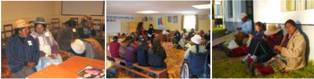
Participantes en el Taller durante el mes de marzo de 2009