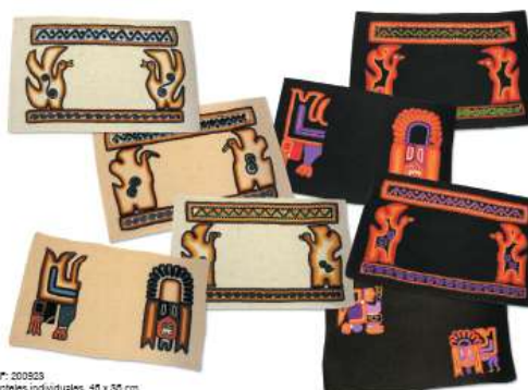
REF. 200823 Mantel individual, 45 x 35 cm Algodón 100%, blanco y negro