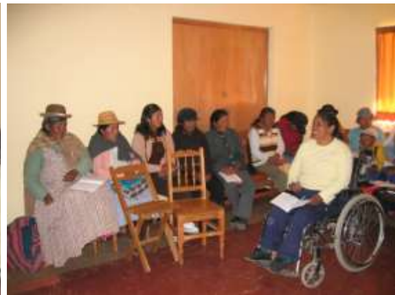
Reunión en la Casa Blanca, sede de la Coordinadora de Mujeres Ayumaras en Juli