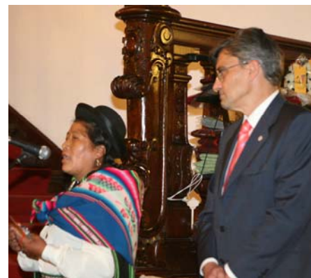
Intervención de la Presidenta de la CMA