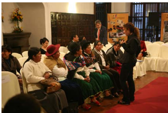
Distintos momentos, 22 de julio 2009, Lima.