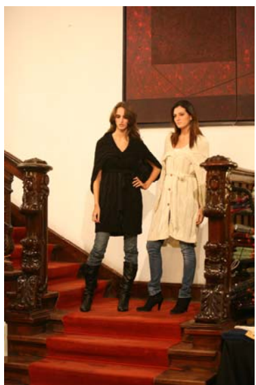
Momentos del desfile con las prendas de moda de la colección .