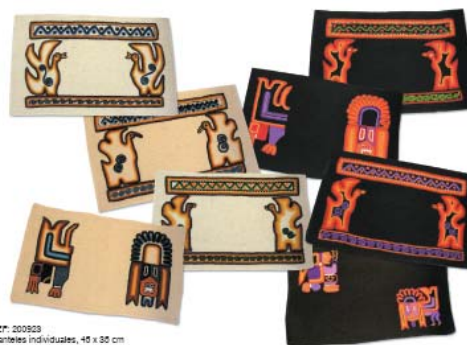
REF: 20923 Variantes individuales, 45 x 30 cm Algodón 100%, Blanco y negro