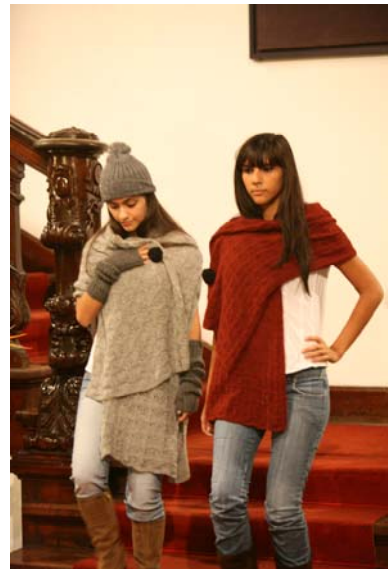
Momentos del desfile con las prendas de moda de la colección .