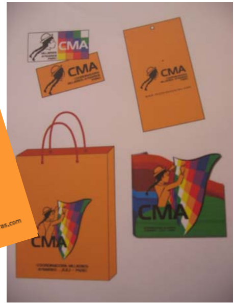
Imagen de marca. Logotipo en etiquetas. Historia de la comunidad en español, inglés y aymara.