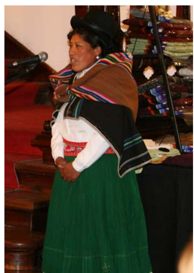
Intervenciones de las representantes de las distintas zonas y la presidenta.