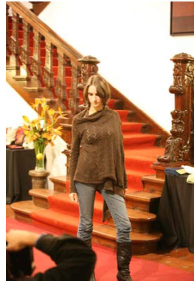
Momentos del desfile con las prendas de moda de la colección .