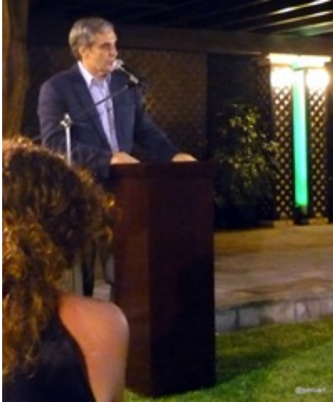
D. Javier Sandomingo, Embajador de España

La presentación tanto del proyecto como de los frutos a la fecha conseguidos entre las artesanas Aymaras y un grupo de diseñadores de moda de España, dio como resultado el lanzamiento de esta colección de moda textil principalmente, llamada colección MODAYMARA 2010.