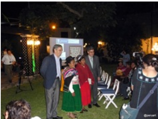
El Sr Embajador con la Presidenta y la Vicepresidenta de la CMA y el Director del Proyecto

La embajada Española se incorpora a este proyecto dentro de su plan de ayuda a la difusión de nuestra cultura pero sobre todo en tratar de aportar a estas comunidades los instrumentos necesarios para poder tener una mejor calidad de vida a los artesanos, al poder proveer de contactos y herramientas que les permita colocar los productos artesanales de esta Zona de Puno al mercado local y global.